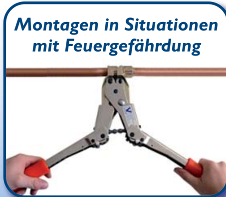
Montagen in Situationen mit Feuergefährdung