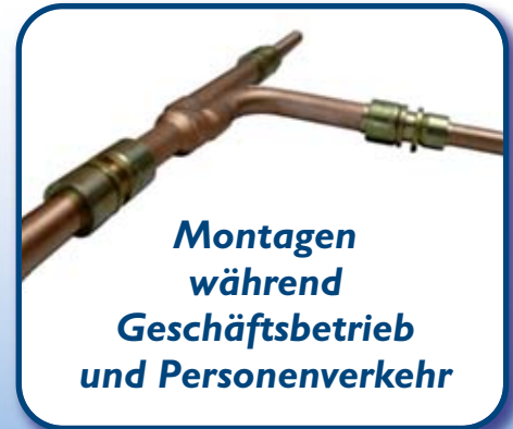
Montagen während Geschäftsbetrieb und Personenverkehr